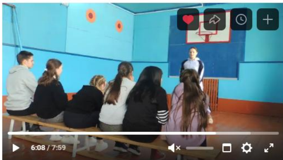
Репетиция школьного театра 717 просмотров